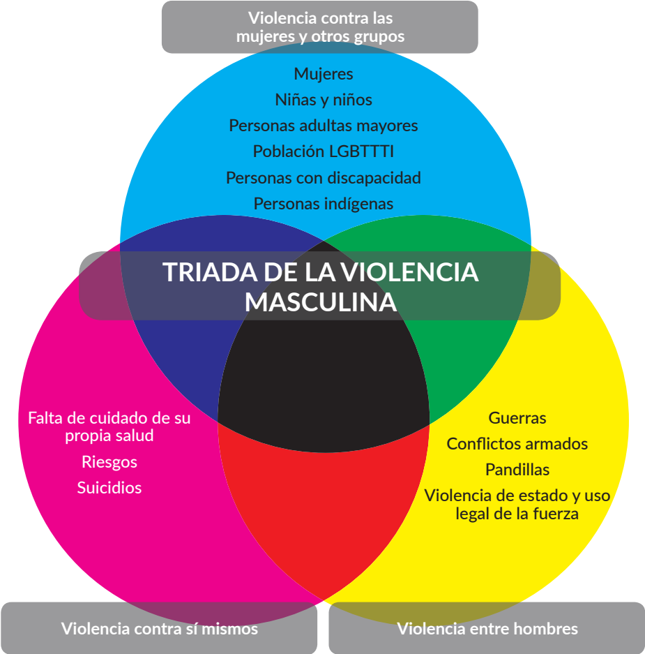
Triada de las violencias ejercidas por hombres

Por tales razones, esta clasificación inicial de las violencias, desde el enfoque de la Agenda, se resume en la siguiente figura: