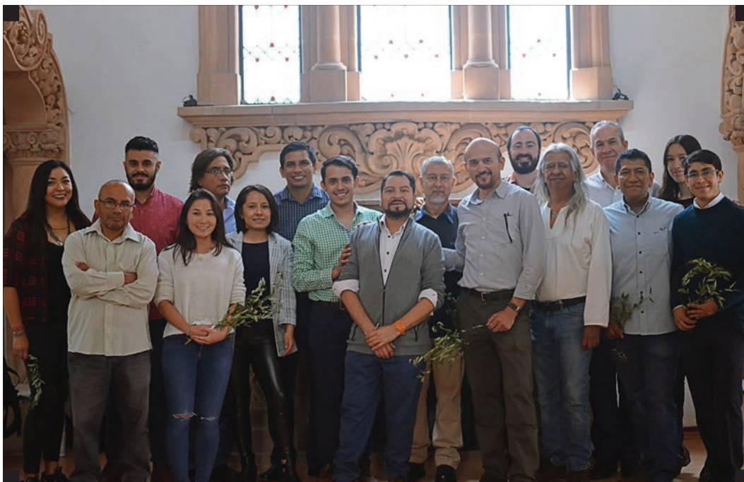
▪ Equipo GENDES en la nueva sede. ▪

Desde este Programa fomentamos el bienestar de las personas que conformamos GENDES y de quienes reciben nuestros servicios. Coordinamos el cambio de sede de nuestras oficinas, mejorando la calidad de los espacios. Asimismo, coordinamos una estrategia de mejora del ambiente laboral, fortalecimos la identidad institucional y trabajamos en la cohesión del equipo en colaboración con un proceso de coaching.