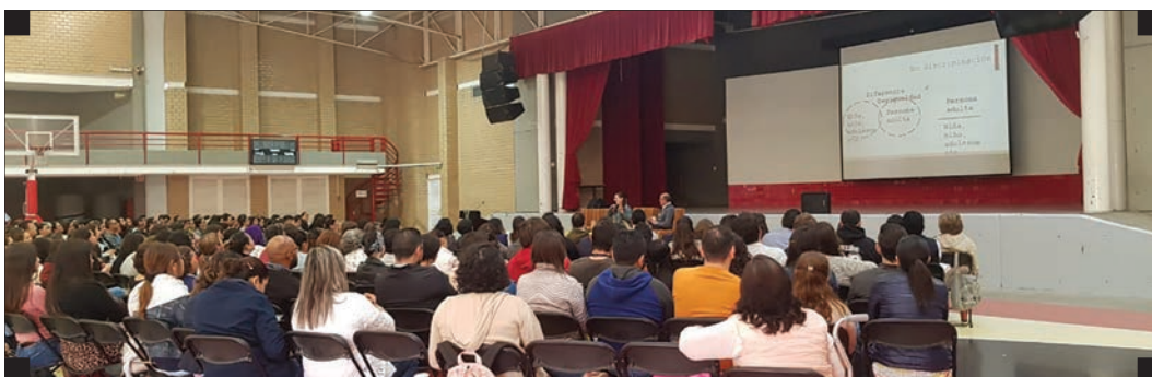
▪ Jornada de Masculinidades en el Instituto LUX, León, Guanajuato ▪