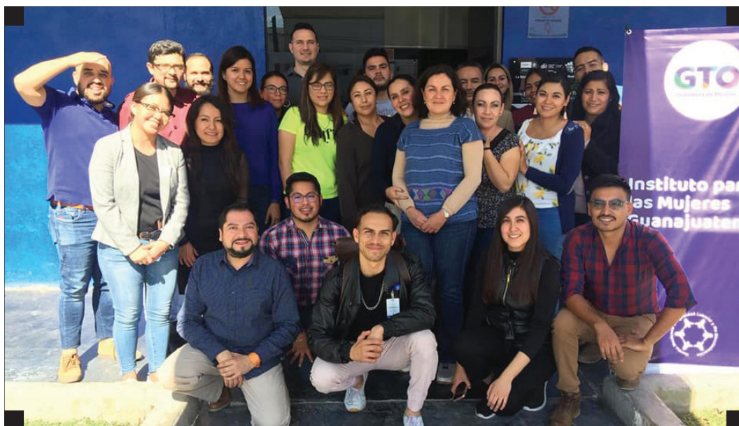
▪ Taller de Prevención del Embarazo Adolescente desde las Masculinidades, Secretaría de Salud e Instituto para las Mujeres Guanajuatenses, León, Guanajuato ▪