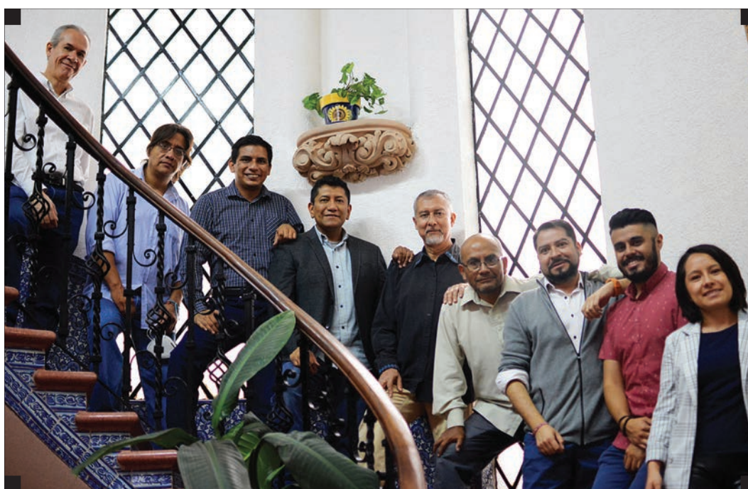
▪ Equipo de Metodología GENDES. ▪

Una característica transversal a las llamadas, es que los hombres expresan la necesidad de contar con espacios de atención emocional y escucha. Es por ello que, como parte complementaria de la estrategia de la Línea de Emergencia, se realizan llamadas de seguimiento y se les invita a incorporarse a los Grupos de Atención a Hombres.