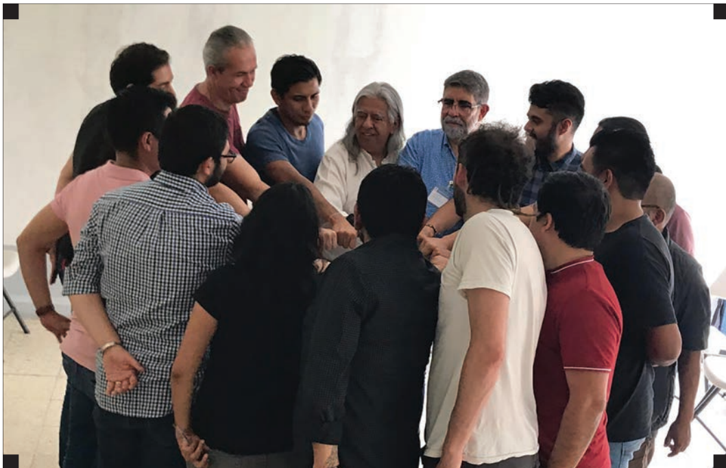
▪ Equipo GENDES del Programa de Metodología ▪

Vale la pena destacar que el 30% de estos usuarios se incorporaron después de hacer uso de la Línea de Emergencia.