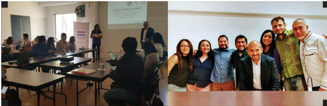
▪ Presentación del diagnóstico y proyecto ¡Ciencias Políticas_Igualdad! con la Universidad Nacional Autónoma de México ▪

Continuamos el trabajo con infancias y adolescencias, gracias al apoyo de Fundación EMpower, así como las capacitaciones para personal del Instituto Federal de Telecomunicaciones y del Instituto Sudcaliforniano de las Mujeres.