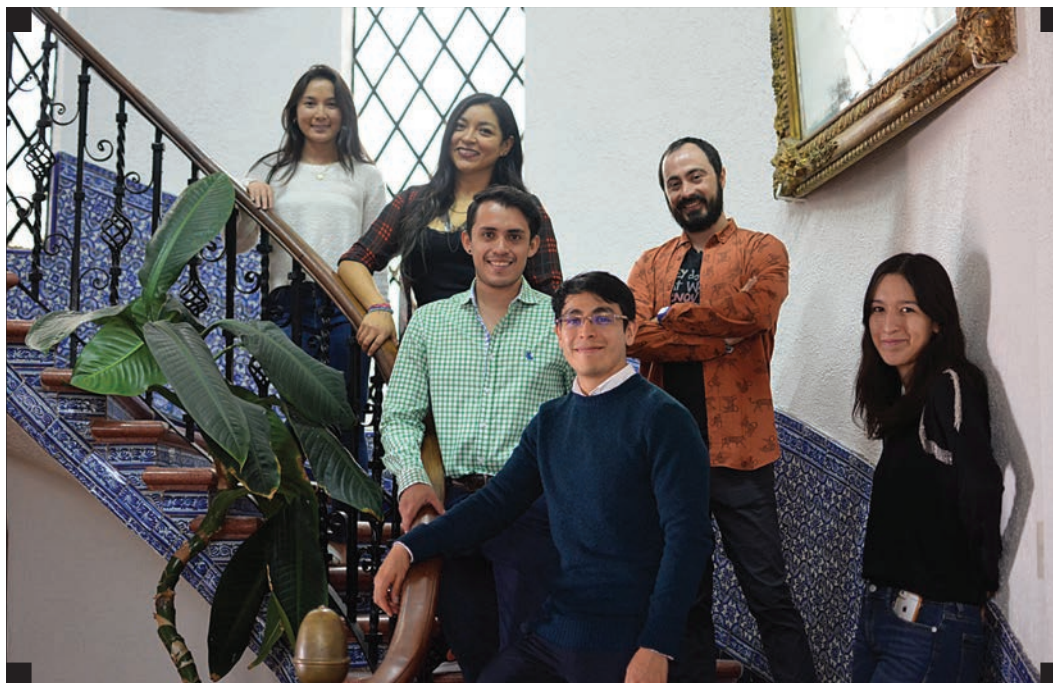
▪ Equipo de Gestión de Recursos, Posicionamiento Público y Desarrollo Institucional. ▪

Este año hemos tenido una colaboración cercana con el comité de Gestión de Recursos del Consejo Consultivo. Para consolidar nuestra estrategia de recaudación de fondos desarrollamos un esquema de cultivo y seguimiento de donantes mediante las siguientes acciones: actualización de directorio de alianzas y contactos vigentes, creación y desarrollo del boletín mensual GENDES, activación del sitio web con capacidad de recepción de donativos únicos y recurrentes y el lanzamiento de una campaña de fin de año.