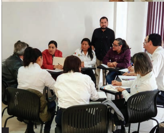
▪ Modelos de Trabajo con Hombres Agresores en el marco del Encuentro de Medidas Reeducativas a Personas Agresoras, Dirección General de Cultura de Paz y Derechos Humanos, Gobierno de Veracruz ▪