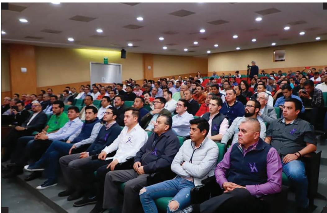
▪ Conferencia de sensibilización en masculinidades ▪

Una de las acciones estratégicas del Subprograma de Atención consiste en la firma de convenios de referencia para el fortalecimiento de los vínculos con profesionales de la salud mental, así como con organizaciones de la sociedad civil, académicas y gubernamentales. Este es un recurso muy valioso en los procesos reeducativos, pues constituye una ruta a través de la cual nos refieren a hombres para que inicien sus procesos. Desde GENDES les acompañamos, con el objetivo de ayudarles a lograr cambios significativos en sus vidas y en las de las personas que les rodean, promoviendo siempre la noviolencia , el buentrato y la igualdad sustantiva.