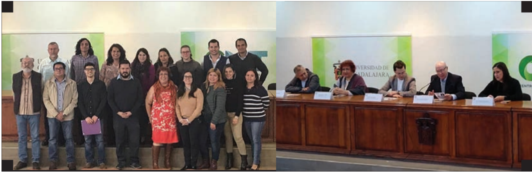
▪ Talleres de prevención de acoso y hostigamiento sexual en el Centro Universitario de Tonalá de la Universidad de Guadalajara ▪

Sin duda, uno de los retos de la pandemia ha sido el innovar y recurrir a alternativas para las intervenciones en materia de capacitación, lo que, por otro lado, nos ha dado beneficios considerables al abrir oportunidades con mayor alcance. Así, aprovechando la virtualidad, en el 2020 llegamos a latitudes insospechadas: