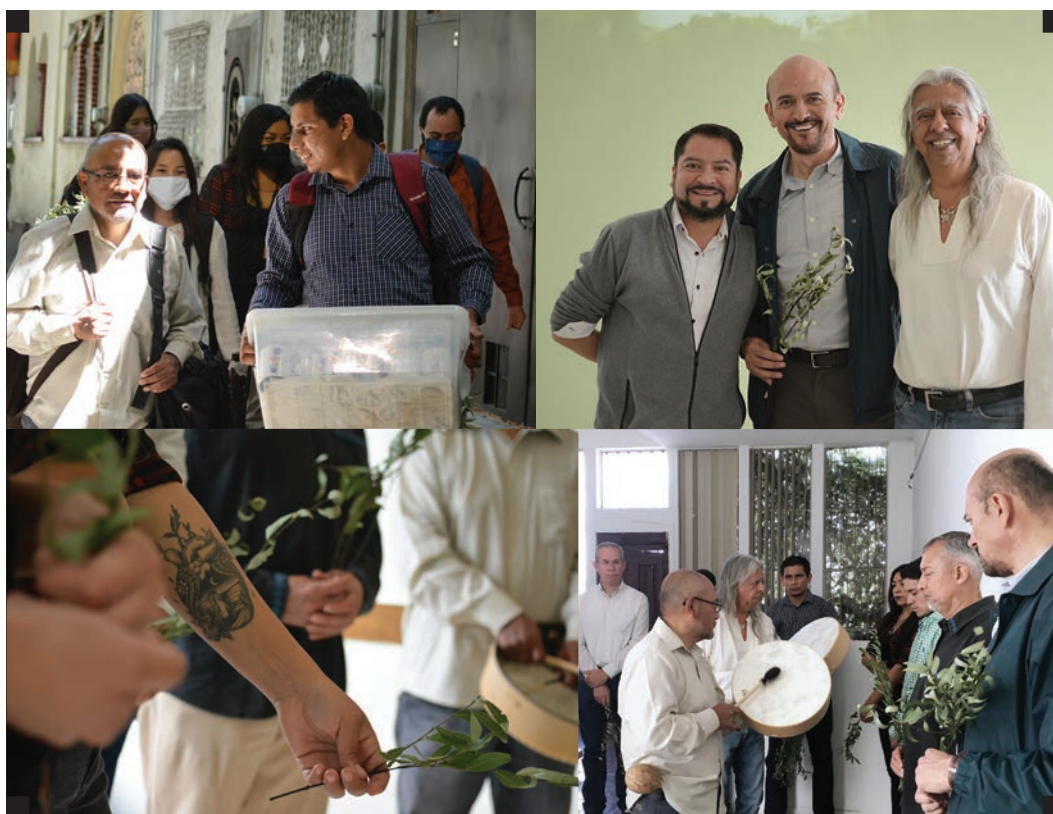
▪ Proceso de mudanza. ▪