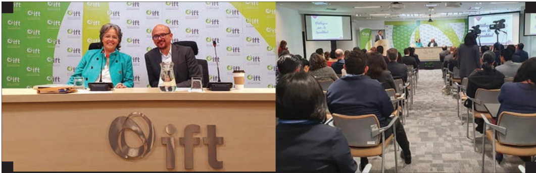
▪ Diálogos por la paz en el Instituto Federal de Telecomunicaciones ▪

De igual manera, participamos en foros, paneles, conferencias, seminarios y conversatorios en redes sociales digitales, que aportaron a la sensibilización de la comunidad con el enfoque que nos caracteriza. El resultado de tanto esfuerzo fue un total de 159 eventos que alcanzaron a 246,256 personas , de las cuales al menos 24,625 estuvieron en conexión directa . Asimismo, se realizó trabajo preventivo con niños, niñas y adolescentes , sumando a más de 6,000 personas beneficiadas directamente en los distintos proyectos de la institución.