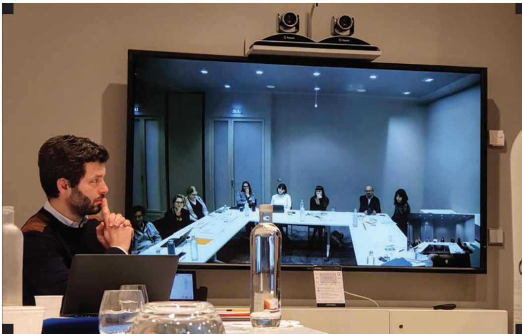
▪ Jurado para la selección de Emprendedores 2020 del Kering Award, París, Francia ▪

Como parte de la Red de Emprendedores Sociales de Kering Foundation, la Dirección General de GENDES fue seleccionada como jurado en Francia en la versión 2020 del certamen dedicado a reconocer a organizaciones innovadoras en erradicar la violencia contra las mujeres. Asimismo, participamos en el Bootcamp de seguimiento con emprendedores de distintas partes del mundo.