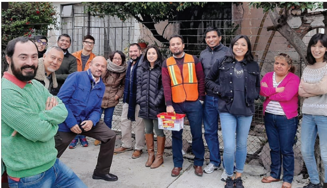
▪ Macro simulacro del equipo GENDES ▪

Ahora bien, GENDES ha logrado un prestigio tanto en el ámbito nacional como internacional, y ha consolidado condiciones materiales y un equipo profesional que se actualiza constantemente. Esperamos que esto nos permita afrontar de manera constructiva los desafíos que se nos presentan. No será fácil, pero nada lo ha sido desde que emprendimos este proyecto social. Simplemente mantenemos nuestra convicción por perseverar y construir nuevas y diversas alianzas que contribuyan a la continuidad de nuestro actuar.